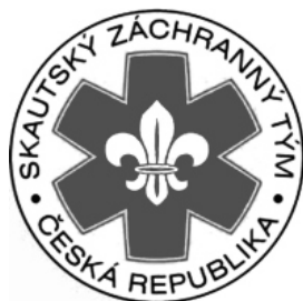
Zvláštní organizační jednotky Junáka