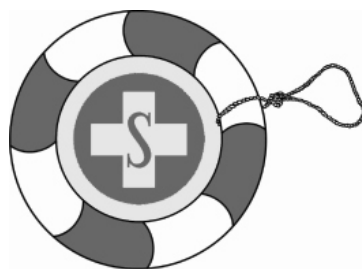
Vodní záchranná služba Asociace samaritánů České republiky