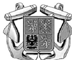
Státní plavební správa