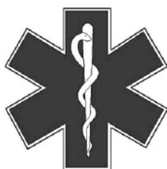
Zdravotnická záchranná služba